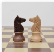
El Arte de Negociar