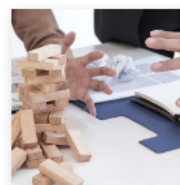
Clínica de Negociaciones al Límite